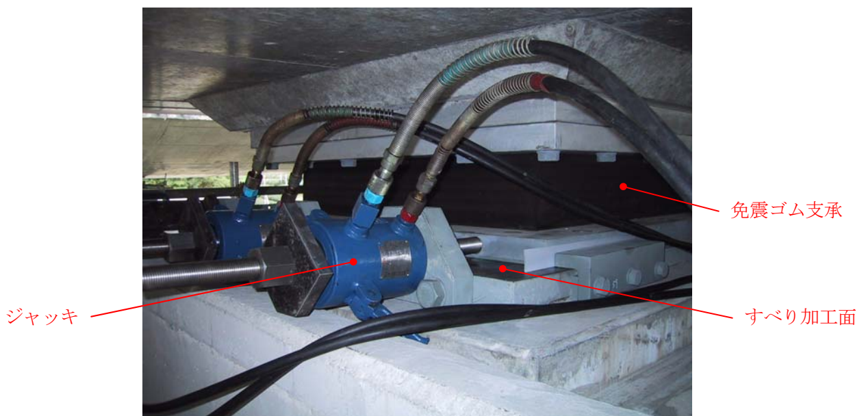
図-3 除変形方式による免震ゴム支承の変形状況

免震ゴム支承は、その特性から長大橋等に使用される事が多い。しかし、常時移動量やコンクリート橋の乾燥収縮等の不静定量が大きく設計不可能や不経済設計等の場合がある。この場合はゴム支承を現場や工場で変形させることで対応することが可能である。代表的な方法としては、所定の変形を与える『与変形方式』と変形を取り除く『除変形方式』があるが、いずれも反力壁等のスペースを必要とするので注意が必要である。図-3に施工状況の写真を示す。